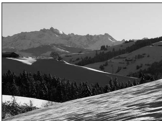
Winterzeit - Fotos Erika Rüegg